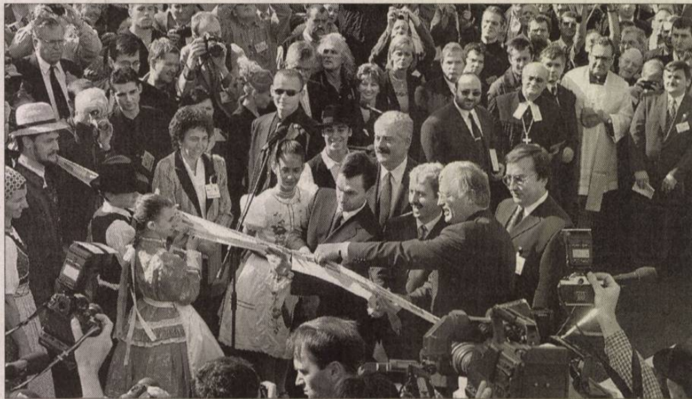
A Mária Valéria hidat átadták (október 10.)