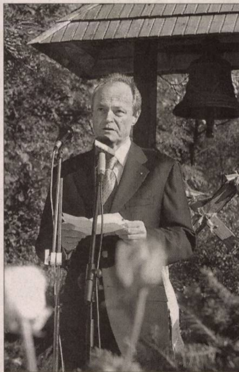
Medgyessy Pétert kifütyülték (október 23.)